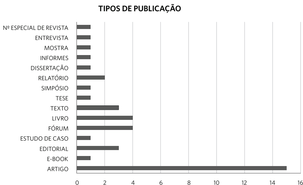
Gráfico 2. Distribuição dos tipos de publicação que compõem a seleção